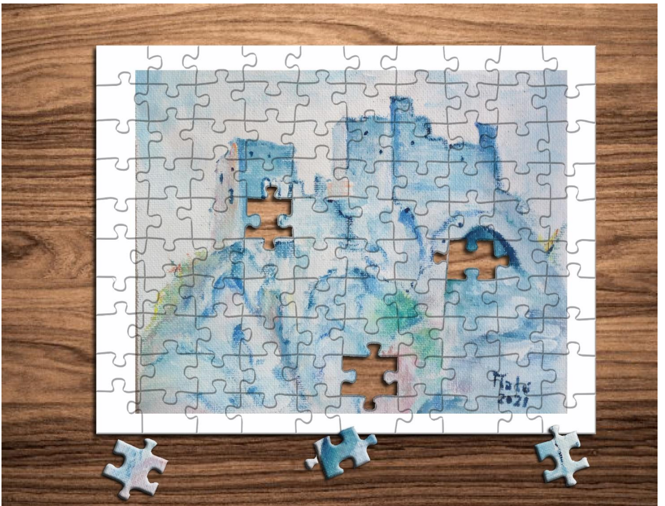
Esempio di puzzle ricavato da dipinto a mano